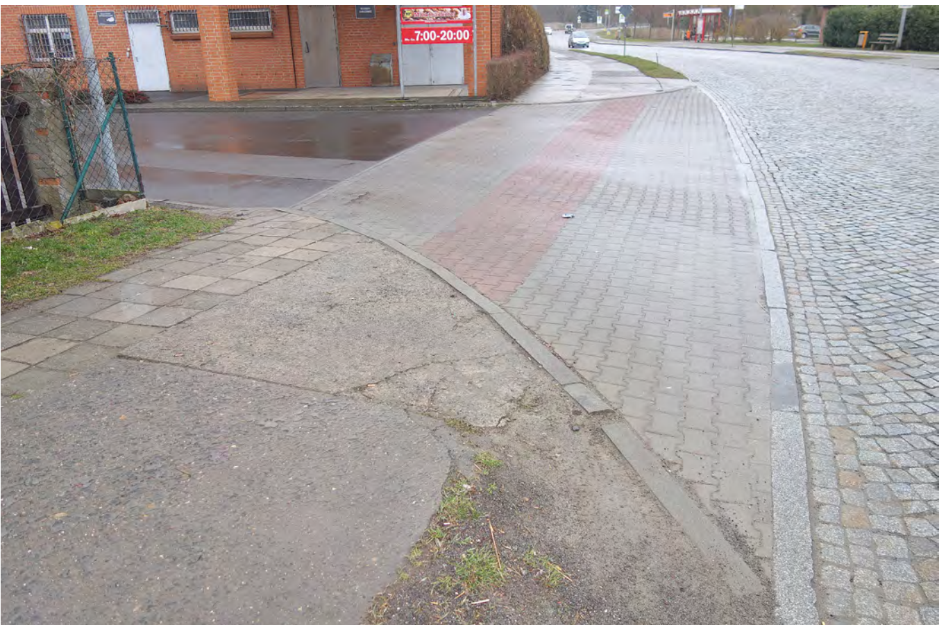
Situation Einfahrt An der Kupka (Einkaufsmarkt), Pflasterung Fahrradfurt Diese Einmündung wird überwiegend von Nutzern des Parkplatzes Einkaufsmarkt und vom Lieferverkehr genutzt und entspricht daher mehr einer Grundstückszufahrt, daher empfiehlt sich die Führung des Geh- und Radweges analog Trüschels Kolonie/Zufahrt An der Kupka (Parkplatz, die ja ggf. entfällt).