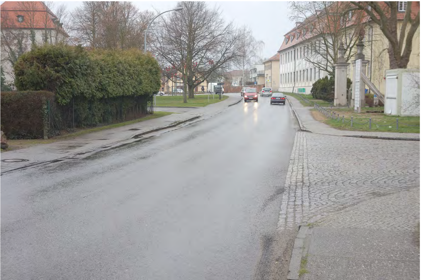
Situation Beginn der Baustrecke, Übergang Bestand / Planung Querung Schloss Hier zeigt sich, dass ausreichend Raum vorhanden ist um im Zuge der Planung und Umsetzung der Querung Schloss beidseitig eigenständige Radverkehrsanlagen anzuordnen. Daher sind auch über die Brücke Schutzgraben und bis zum Beginn der Baustrecke diese Radverkehrsanlagen zu führen.