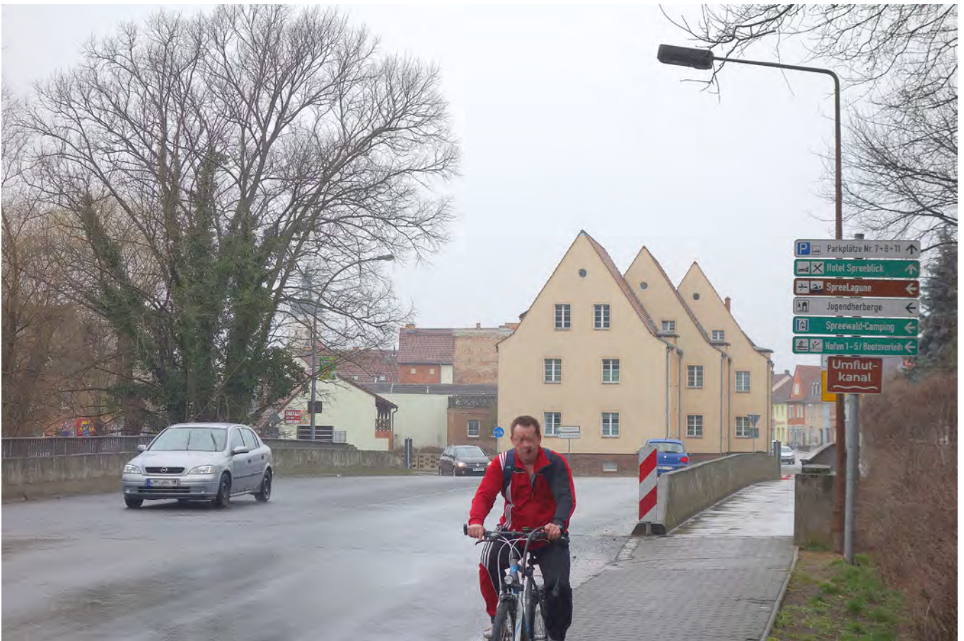
Situation Brücke über den Umflutkanal (Nordseite, Richtung Osten)

Darstellung des linksseitigen Fahrradverkehrs von der Gubener Strasse kommend. Daher ist auf der Nordseite ein Zweirichtungsradweg einzurichten. Hier zeigt sich auch die städtebauliche Bedeutung der erhaltenswürdigen und erhaltensfähigen 5-stämmigen Ulme.