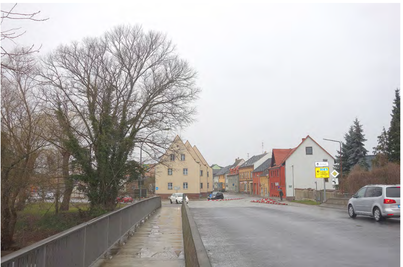
Situation Brücke über den Umflutkanal (Südseite, Richtung Osten)

Darstellung des linksseitigen Fahrradverkehrs von der Gubener Strasse kommend. Daher ist auf der Nordseite ein Zweirichtungsradweg einzurichten. Hier zeigt sich auch die städtebauliche Bedeutung der erhaltenswürdigen und erhaltensfähigen 5-stämmigen Ulme.